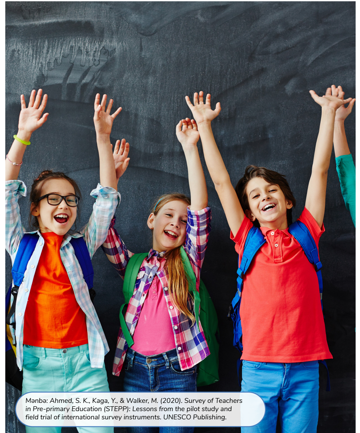
Mənbə: Ahmed, S. K., Kaga, Y., & Walker, M. (2020). Survey of Teachers in Pre-primary Education (STEPP): Lessons from the pilot study and field trial of international survey instruments. UNESCO Publishing.

Hesabatdan belə nəticəyə gəlmək olar ki, bu sorğu vasitəsilə əksər ölkələr qısa müddət ərzində böyük irəliləyiş əldə edə biləcəklər. UNESCO layihənin birinci mərhələsinin nəticəsinə əsaslanaraq, hazırda Milli Repräsentativ nümunələrdən istifadə etməklə, əsas tədqiqatın hazırlanmasından və aparılmasından ibarət 2-ci mərhələni planlaşdırır.